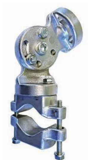
Système Porte Torche A ROTULE