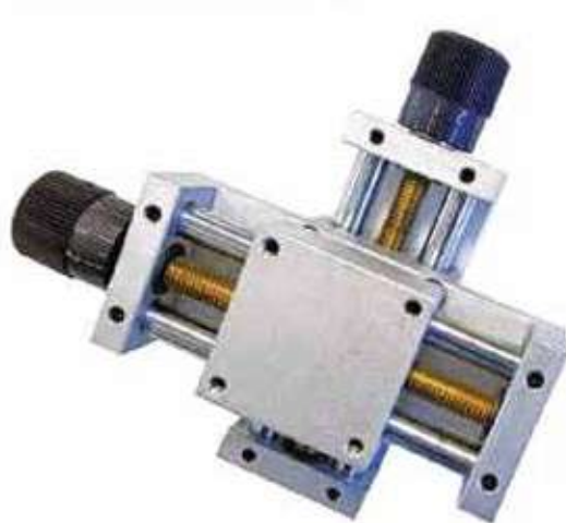
Glissiere croisée avec réglage manuel (course 50x50mm) - sml 50x50