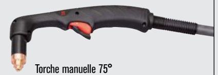
Torche manuelle 75°

(pour plus d'options de torche, consulter www.hypertherm.com )