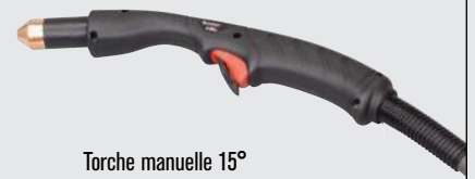
Torche manuelle 15°