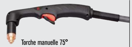
Torche manuelle 75°

(pour plus d'options de torche, consulter www.hypertherm.com )