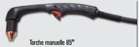
Torche manuelle 85°

Styles de torches standards Duramax® Hyamp™ (pour plus d'options de torche, consulter www.hypertherm.com )