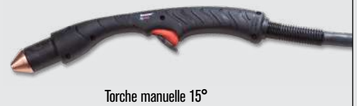
Torche manuelle 15°